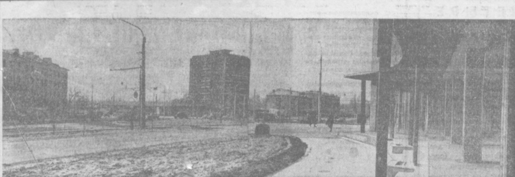
ТАШКЕНТ СЕГОДНЯ. САПЕРНАЯ ПЛОЩАДЬ.