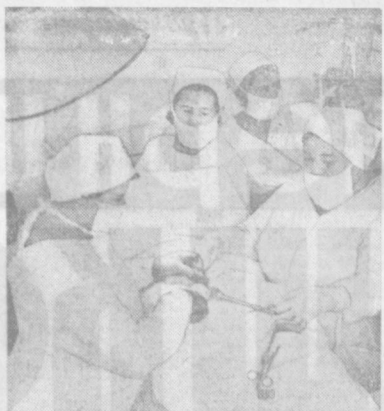
Медицинская часть завода имени Чкалова является лечебницей, оснащенной современным медицинским оборудованием. Ежегодно здесь лечатся тысячи трудящихся.