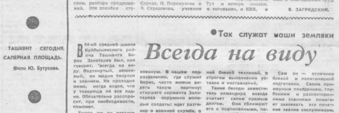
ТАК СЛУЖАТ НАШИ ЗЕМЛЯКИ.