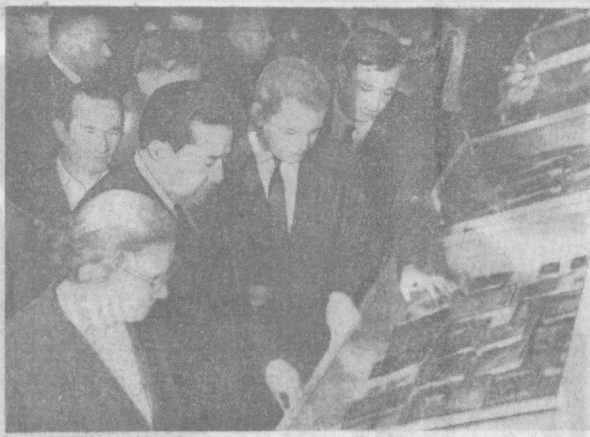
НА ВЫСТАВКЕ ПРОИЗВЕДЕНИИ ПИСАТЕЛЕЙ СТРАН АЗИИ И АФРИКИ, ОТКРЫВШЕИСЯ В ПОМЕЩЕНИИ ТЕАТРА ИМ. ХАМЗЫ.