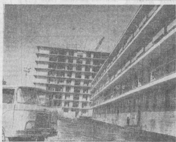
НА СНИМКЕ: ДОМ, ПОСТРОЕННЫЙ ЛЬВОВСКИМИ СТРОИТЕЛЯМИ.