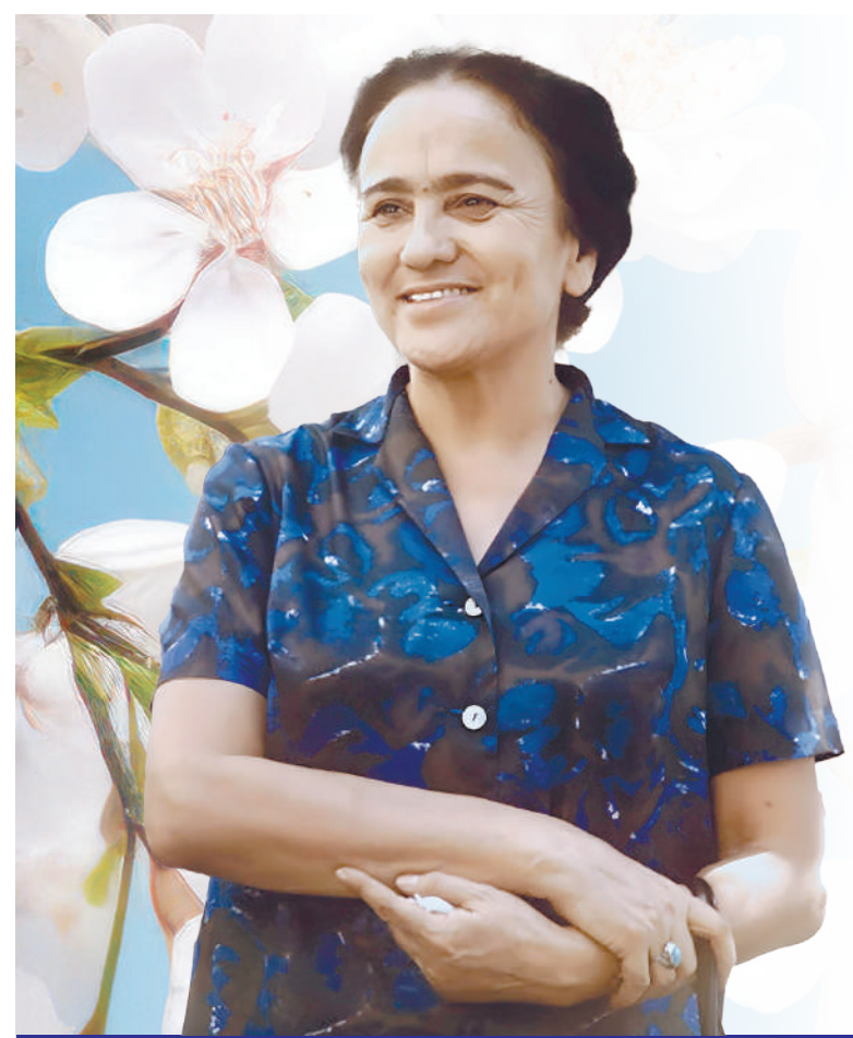
ЗУЛФИЯ, Ўзбекистон халқ шоири