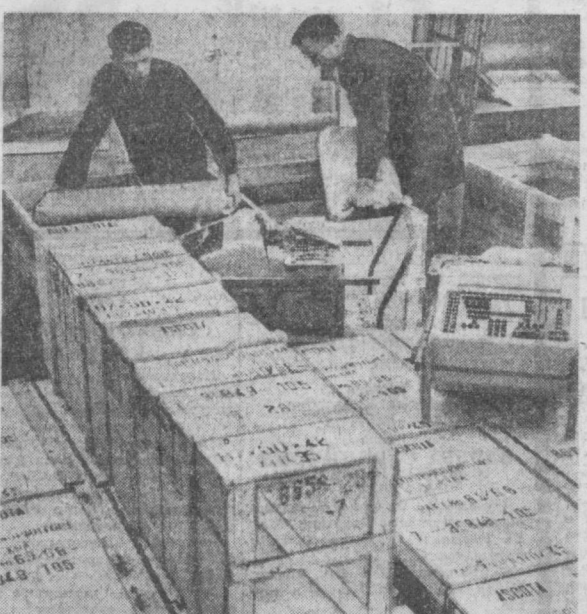
НА СНИМКЕ: народное предприятие «АСКОТА» (бухгалтерские машины) до 7 ноября выполнит все экспортные обязательства по отношению к Советскому Союзу и до 22 декабря реализует дополнительный договор на 400 машин.

То, что немцы любят путешествовать, подтверждает необычайная популярность народных пеев, воспевающих странствия и туризма. Такие и сегодняшних граждан ГДР манят далекие страны. Этот факт подтверждают сухие цифры. Только в 1967 году побывало, например, 1307459 человек в СССР, 461 270 — в Польской Народной Республике, 131 280 — в Советском Союзе, 85 868 — в Румынии, 120 000 — посетили Болгарию и 223 027 — Венгрию. Внутри самой страны 1 200 000 граждан провели свой отпуск по путевкам за невысокую плату в 1 200 домах отдыха Объединения свободных немецких профсоюзов. При этом речь идет, как можно это сразу заметить, лишь о лицах, статистически охваченных бюро путешествий или курортными организациями. Не принимая в расчет школьников, в ГДР ежегодно путешествует от 4,5 до 5 миллионов человек, что составляет около 35 процентов всего взрослого населения страны. Не отграничивая в этих цифрах короткие путешествия или поездки на субботу-воскресенье; другими словами, эти данные охватывают только путешествия, начавшиеся от шести дней и больше.