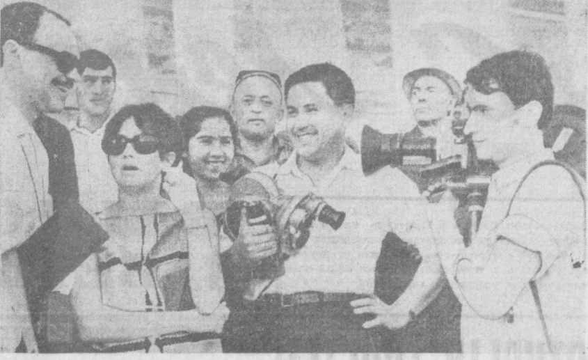
НА СНИМКЕ: группа кинодетей студии «ДЕФА» (ГДР) среди своих узбекских коллег Ташкентской студии хроникальных фильмов.

БОНН. Федеральным комитет по созданию вновь Коммунистической партии в ФРГ получил письмо первого секретаря ЦК КПГ Макс Реймана, который приветствует шаг, предпринятый комитетом. Как подчеркивается в письме, М. Рейман с большим интересом ознакомился с заявлением федерального комитета, опубликованным 25 сентября во Франкфурте-на-Майне.