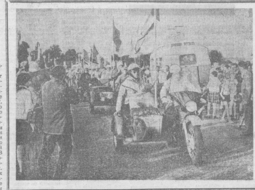
НА СНИМКЕ: КОМСОМЛЬЩИКИ ГДР НА МОТОЦИКЛАХ ПОД ЛОЗУНГОМ «ЗНАМЯ ОКТЯБРЯ» ЕДУТ ПО ТЕМ ДОРОГАМ, ПО КОТОРЫМ ВО ВРЕМЯ ВТОРОЙ МИРОВОЙ ВОЛНЫ СОВЕТСКАЯ АРМИЯ ОДЕРЖАЛА ПОВЕДУ НАД ГИТЛЕРОВСКИМ ФАШИЗМОМ.

Город Вильгельм-Пик-Штадт Губен (раньше он назывался просто Губен) принадлежит к числу городов с развитой текстильной промышленностью. Новый, недавно построенный здесь комбинат химического волокна дает значительную часть синтетического волокна для