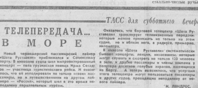
Трасса для субботающего вечера

НЕТ, это не Алтай и не Саяны. Это наши края, один из уголков Средней Азии. Восточная часть Чаткальского хребта. Она специально создана для туризма, экскурсий, разного вида отдыха.