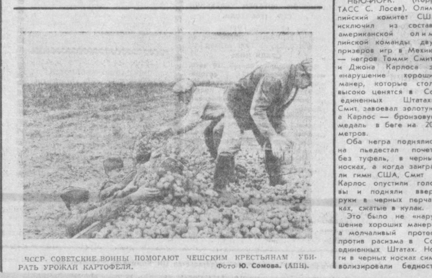
СССР, СОВЕТСКИЕ ВОИНЫ ПОМОГАЮТ ЧЕХСКИМ КРЕСТЬЯНАМ УБИРАТЬ УРОЖАЙ КАРТОФЕЛЯ.