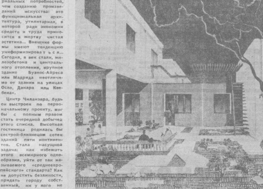
Фото Б. Гуляева.

не останутся под спудом. Были выработаны принципы, сформированы убеждения... Все это вскоре нашло материализацию в проекте ансамбля улицы Богдана Хмельницкого. Тема городской улицы предстала архитектурю Косинскому опять-таки музыкальным произведением. Но здесь интеллигентный, другой ритм. Эта музыка полифонична и ритмична. Она создается по правилам контрапункта, где отдельные голоса сливаются в гармонию. Улица Богдана Хмельницкого — главная артерия города в направлении «за город» — центр». Сразу же за автостанцией уже начато. Скоро там поднимется дома-сады, в которых житье будет не только вверху, двенадцатого или пятнадцатого этажа, и глянув в окно, увидишь рядом с собой цветники и газоны на соседней крыше. Невольно приходишь к сравнению с садами Семирамиды. В Средней Азии трудно жить вдали от земли, от воды. Архитектор А. С. Косинский создает типовой проект двухэтажного жилого дома с квартирами в двух уровнях, садиком с арками, местом для гаража. «Через несомненно десятилетия в городе, построенном архитектором — нашими современниками и земляками, родится и вырастет человек третьего тысячелетия. Не понапустит ли ему неудобности, неудобности построенные при нас интеллигент? Это зависит только от наших задумок. Лицо будущего Ташкента лепится сегодня. С. КОНЦЕВОВСКИЙ. НА СНИМКАХ: фрагмент внутреннего двора двухэтажного дома; фрагмент жилого дома. Фото Б. Гуляева.