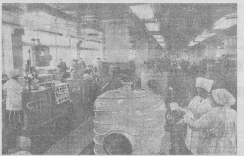
Досрочно, более чем на месяц раньше срока, выполнил план третьего года девятой пятилетки по реализации продукции коллектива Ташкентского завода электронной техники имени В. И. Ленина. Приспосаблились решить выполнить пятилетку за 4,5 года. ИА СНИМКЕ: в одном из цехов завода.