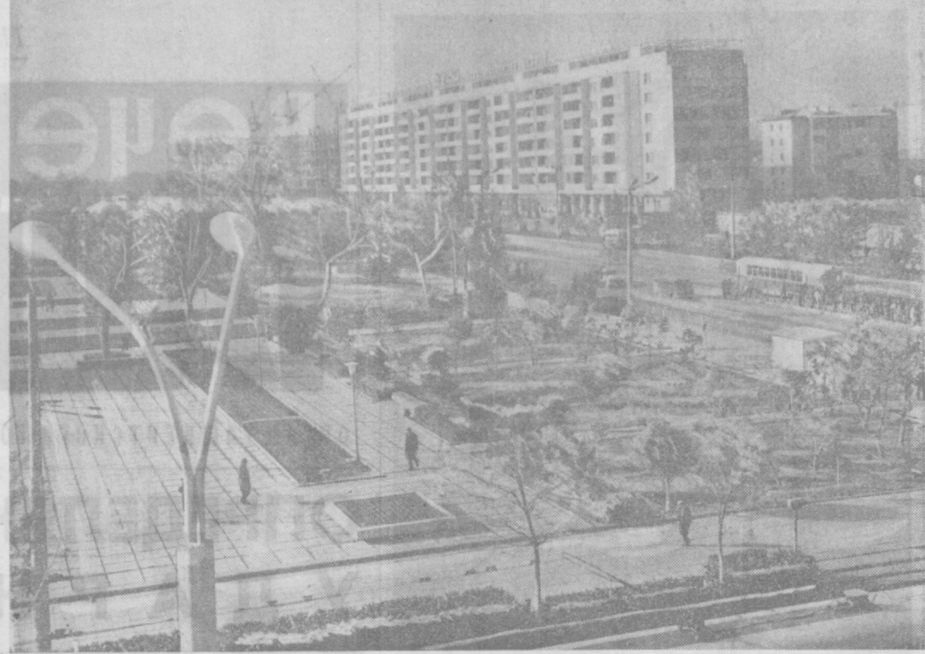
С каждым годом хорошеет столица нашей республики — Ташкент. Ее украшают новые жилые дома, административные здания, скверы и парки. НА СНИМКЕ: вид на бульвар имени В. И. Ленина.

Это те вопросы, на решение которых, на наш взгляд, необходимо сосредоточить особое внимание при подведении итогов выполнения двусторонних договоров за 1973 год между соревнующимися районами.