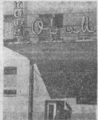
Фото и текст Р. Бибишева.