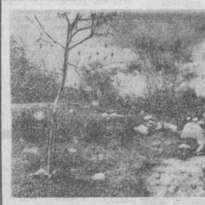
ОСЕНЬ В ПРЕДГОРЬЯХ ЧИМГАНА.