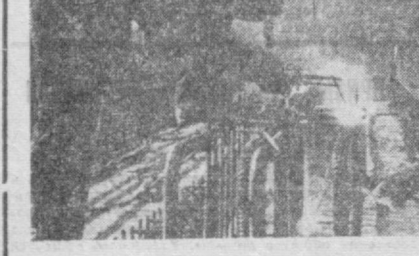
Недалеко от Комсомольской площади строители СУ-2 треста 11 «Высотстрой» возводят здание ГУМа.

На его трех этажах разместится около 400 торговых точек. На 4-м этаже — ресторан. О