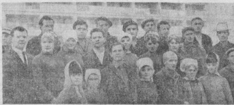
НА СНИМКЕ: ГРУППА СТРОИТЕЛЕЙ ТУЛЬСКОГО СТРОИТЕЛЬНО-МОНТАЖНОГО ПОЕЗДА.