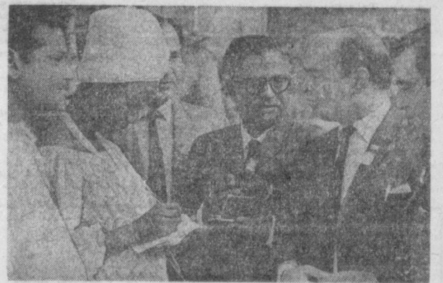
Участники кинофестиваля обмениваются мнениями.

участники кинофестиваля совершили экскурсию на Ташкентский текстильный комбинат и во Дворец текстильщиков, где встречались с членами Комитета защиты мира. Гости также побывали на фабрике текстильного комбината, побеседовали с передовиками производства. Им было необычайно интересно узнать, какие новые ткани и каких рисунков, расцветок готовят текстильщики.