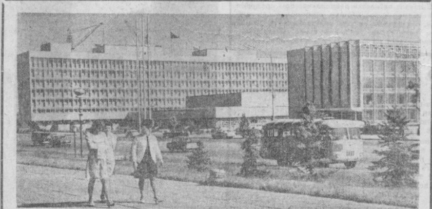
ТАШКЕНТ СЕГОДНЯ. ПЛОЩАДЬ ИМЕНИ В. И. ЛЕНИНА.