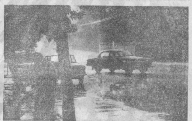
А ДОЖДЬ ИДЕТ...