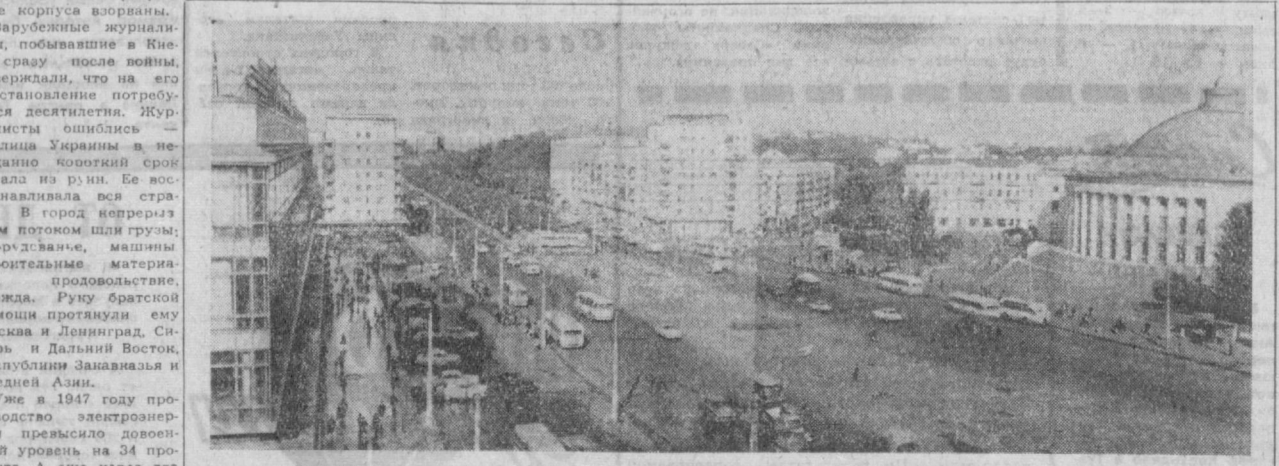
НА СНИМКЕ: Киев. Площадь Победы.

В другом конце города — Святошино — возводится крупный городок Академии наук Украинской ССР. Со временем рядом с ним вырастет комплекс спортивных сооружений — стадион, плавательный бассейн, спортивные площадки. По расчетам, к 1980 году население украинской столицы приблизится к двум миллионам. Разумеется, увеличится и жилой фонд города. Пройдут изменения и в характере его застройки. Киев будет расти в высоту. Уже появились первые шестнадцатиэтажные дома. На очереди — здания в 24—32 и больше этажей. Планом предусмотрено широкое социально-культурное строительство. В два раза увеличатся автобусные и троллейбусные маршруты. Линия метрополитена протянется на 62 километра. К концу этой пятилетки киевляне получат новый вид современного транспорта — монорельсовую дорогу. Ее первый участок возьмет свое начало у Днепра, в районе жилого массива Русаловна. В дальнейшем трасса монорельсовой дороги протянется до Борисполя и свяжет город с аэро-