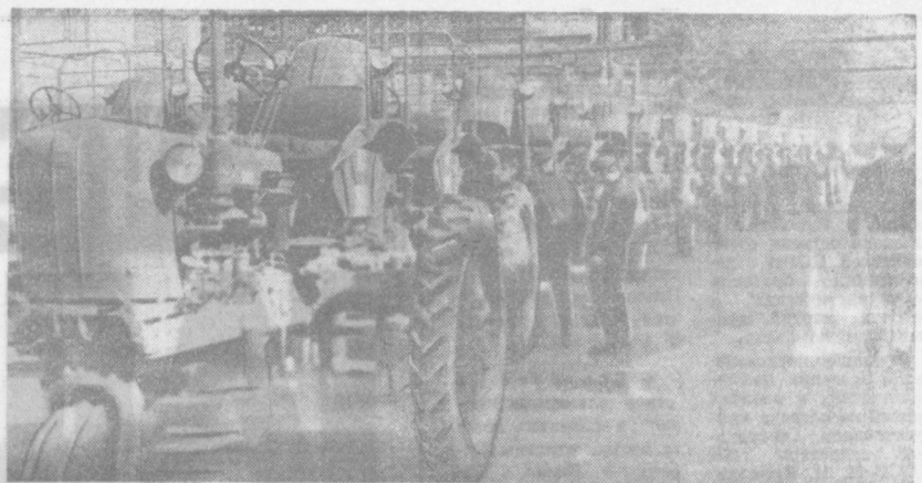
ТАШКЕНТСКИЙ ТРАКТОРСОБОРОТНЫЙ ЗАВОД. НА СНИМКЕ: готовая и отправке партии новых тракторов марки «Т-28Х4».