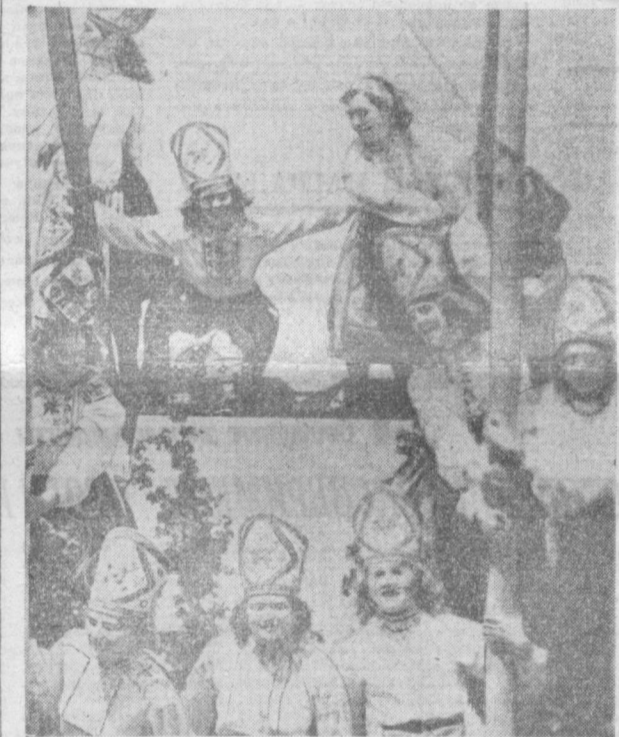
НА СНИМКЕ: эстонские девушки на качелях.

Митинг окончился. Завтра в здании Государственного академического Большого театра оперы и балета имени Алишера Навои состоится торжественное открытие эстонской декады литературы и искусства в Узбекистане. С ответным словом выступил Председатель