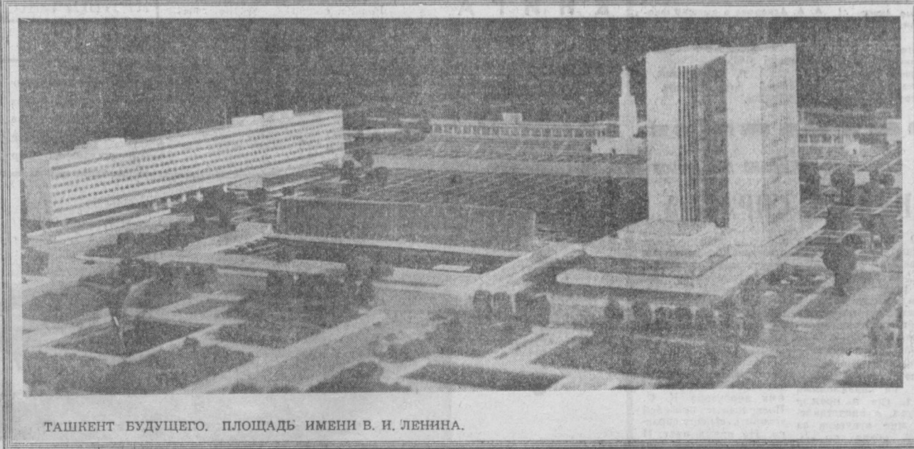
ТАШКЕНТ БУДУЩЕГО. ПЛОЩАДЬ ИМЕНИ В. И. ЛЕНИНА.