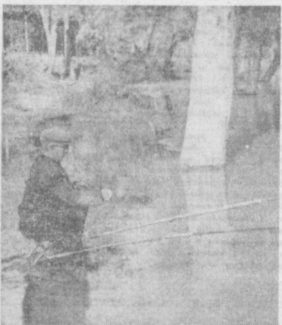
НА РЫБАЛКЕ...