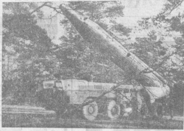
НА СНИМКЕ: ПОДВИЖНАЯ СТРАТЕГИЧЕСКАЯ УСТАНОВКА НА СТАРТОВОЙ ПОЗИЦИИ.