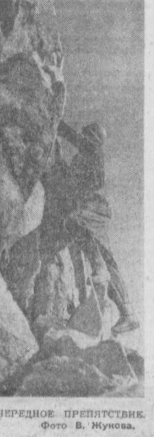
ПРЕОДОЛЕВАЕТСЯ ОЧЕРЕДНОЕ ПРЕПЯТСТВО.