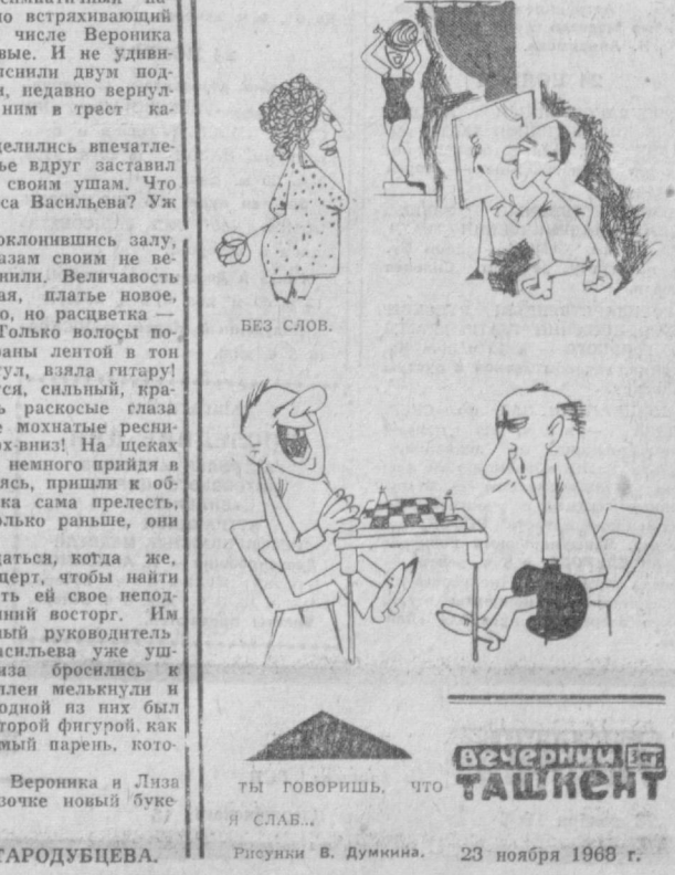
БЕЗ СЛОВ. Ты говоришь, что я слава... Рисунок В. Думкина. 23 ноября 1968 г.