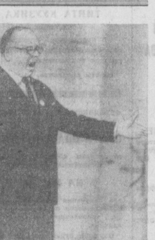
НА СНИМКЕ: народный артист СССР Титт Куузуйи исполняет арию Фигаро из оперы «Севильский цирюльник».

После древних таллинских ирпестовых сооружений ставит по замыслу эстонских архитекторов, романтическим местом отдыха туристов. Вслед за реставрацией самой мощью в Прибалтике орудинной башни Кингиде-нек в которой недавно открылся филиал городского музея, архитекторы приступили к восстановлению гледающей — «Нейтс тори» (Девичья башня), где располагается кафе-музей. Интерьер этого своеобразного кафе полностью сохранил колорит средневековья.