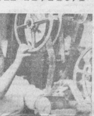
Больших успехов добились недавно кондитеры фабрики «Уртак». Они завоевали вторую денежную премию Министерства пищевой промышленности Узбекистана по итогам социалистического соревнования третьего квартала и десяти месяцев. Кондитеры обязались до конца года выдать сверх плана около 100 тонн продукции.

На снимках запечатлены лучшие передовики предприятия, работающие в эти дни в счет нового 1969 года.