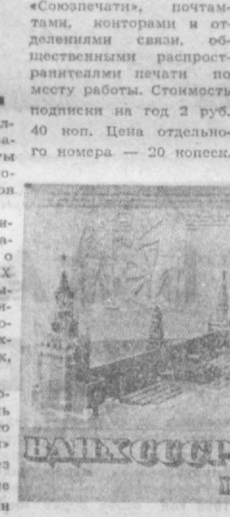
«Союзпечать», почтамтам, которыми и оформлены связи, обязательны распространяются почтой по месту работы. Стоимость подписки на год 2 руб. 40 коп. Цена отдельного номера — 20 копеек.

Подписка на Информационный бюллетень ВДНХ СССР (индекс по каталогу «Союзпечать» 70305) принимается без ограничений в течение всего года пунктами