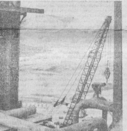
На Чукотке сооружен первый в Заполярье рудник по добыче ртути. Его назвали «Пламенный». Среди сопков в зоне вечной мерзлоты поднялся производственный корпус, одновременно закончилась строительство административно-бытового комбината. Рядом разместились электростанция и здание химической лаборатории.

Новый промышленный объект уже набирает темпы — в августе прошлого года были получены первые килограммы ртути, а в этом году в начале октября металлурги рапортовали о досрочном выполнении годового плана.