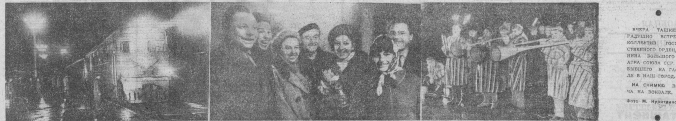
Вчера ташкентцы радужно встретили коллектив Государственного ордена Ленина Большого театра Союза ССР, прибывшего на гастроли в наш город. На снимке: встреча на вокзале.