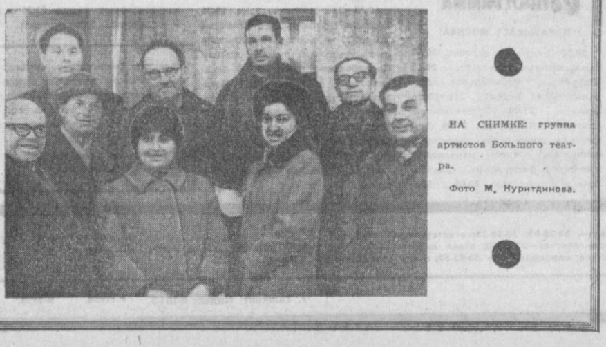
НА СНИМКЕ: группа артистов Большого театра.