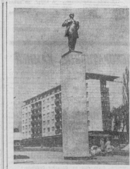
ЧЕХОСЛОВАЦКАЯ СОЦИАЛИСТИЧЕСКАЯ РЕСПУБЛИКА. Памятник В. И. Ленину в городе Младоболеслав, на площади, носившей имя вождя пролетариата.

...и 60-х годов Ежедневно на республиканский Центральный аптечный склад в Ташкент сейчас прибывает до двух тысяч наименований различных лекарств и витаминов. Их все исчисляется десятками тонн. Новейшее аптечное оборудование поступает