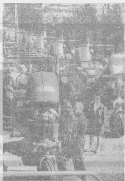
22 тысячи тракторов марки «Т-28ХЗ» и «Т-28Х4»

выпустят в нынешнем году узбекские тракторосборщики. Родина уже получила более 20 тысяч таких тракторов.