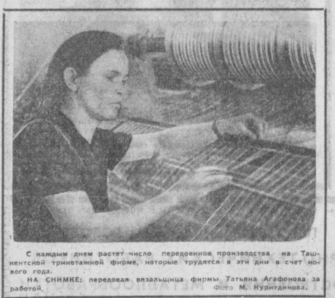
С каждым днем растет число передовиков производства на Ташкентской трикотажной фабрике, которые трудятся в эти дни в счет нового года.

ри и каждый раз ловишь себя на мысли: ведь многое, собственно, могли бы тут сделать и без жалоб в партийные, советские органы, в редакцию газеты. Иной раз не только могли, а просто обязаны были сделать своевременно». И еще на одно обращение внимание: мысленно принимаются, а жалобы все идут. Причем сходный, аналогичный. Делаем житейским, квартирным, бытовым — газету, уделяет много внимания. Эти темы поре газеты печатаются материальны под рубрикой «Вечерний Ташкент» писем для принятия ответов». — Пишет нам группа авторов. — Читаете такие ответы на принятые ме-