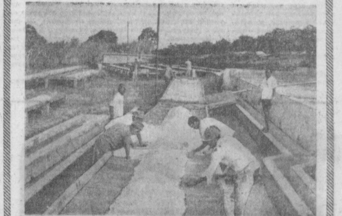
РЕСПУБЛИКА КЕНИЯ. За последние годы Кения вышла на одно из первых мест среди стран-экспортеров кофе. НА СНИМКЕ: просушка кофейных зерен.

На днях республиканская студия телевидения снимает сценки короткометражного фильма о работе предприятий службы быта.