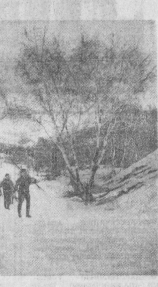
НА ЧИМГАНСКИЕ КРУГИ...