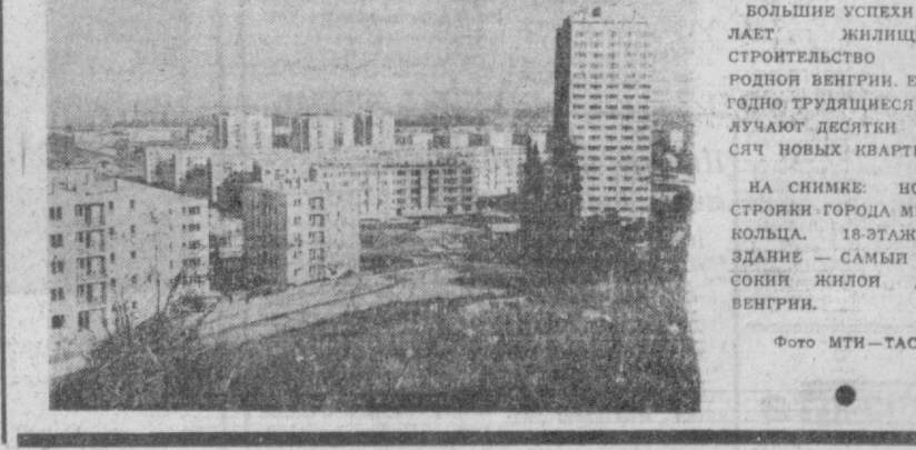
БОЛЬШИЕ УСПЕХИ ДЕЛАЕТ ЖИЛИЩНОЕ СТРОИТЕЛЬСТВО НАРОДНОЙ ВЕНГРИИ. ЕЖЕГОДНО ТРУДЯЩИЕСЯ ПОЛУЧАЮТ ДЕСЯТИ ТЫСЯЧ НОВЫХ КВАРТИР. НА СНИМКЕ: НОВОСТРОЙКА ГОРОДА МИШКОЛЬЦА. 18-ЭТАЖНОЕ ЗДАНИЕ — САМЫЙ ВЫСОКИЙ ЖИЛОЙ ДОМ ВЕНГРИИ.