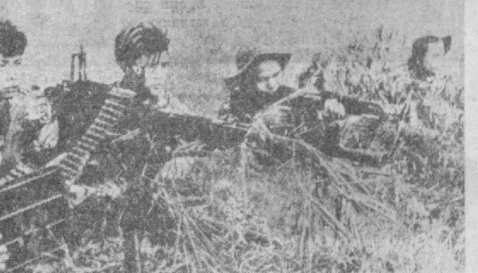
НА СНИМКЕ: засада бойцов НВСО в одной из районов провинции Тхайнин.