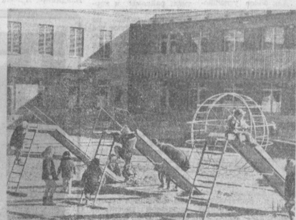
НА СНИМКЕ: детский сад, построенный литовскими строителями в 24-ом квартале Чиланзара.