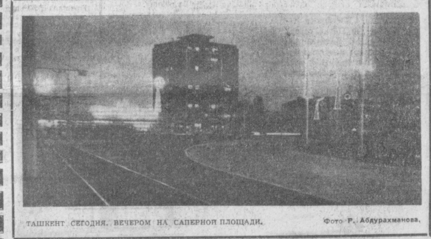
ТАШКЕНТ СЕГОДНЯ. ВЕЧЕРОМ НА САПЕРНОЙ ПЛОЩАДИ.