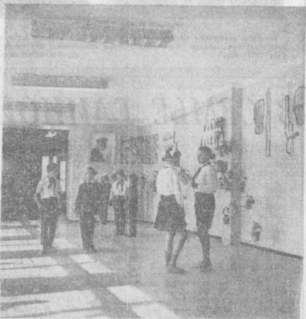
НА СНИМКЕ: Е ФОНЕ ШКОЛЫ, ПОСТРОЕННОЙ СТРОИТЕЛЯМИ ИЗ ПОДМОСКОВЬЯ НА ЧИЛАНЗАРЕ.