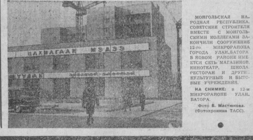
МОНГОЛЬСКАЯ НАРОДНАЯ РЕСПУБЛИКА. СОВЕТСКИЕ СТРОИТЕЛИ ВМЕСТЕ С МОНГОЛЬСКИМИ КОЛЛЕГАМИ ЗАКОНЧИЛИ СООРУЖЕНИЕ 12-го МИКРОРАЙОНА ГОРОДА УЛАНБАТОРА В НОВОМ РАЙОНЕ ИМЕЕТСЯ СЕТЬ МАГАЗИНОВ, КИНОТЕАТР, ШКОЛА РЕСТОРАН И ДРУГИЕ КУЛЬТУРНЫЕ И БЫТОВЫЕ УЧРЕЖДЕНИЯ. НА СНИМКЕ: в 12-м МИКРОРАЙОНЕ УЛАНБАТОРА.

ЗАПАДНЫЙ БЕРЛИН. Западноберлинский правящий бургомистр Шюц вновь высказался в поддержку абсурдных притязаний официального Бонна на Западный Берлин. (ТАСС).