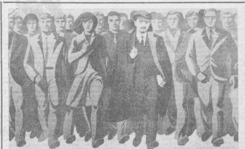
МОСКВА. Издательство «Советский художник» выпускает к 100-летию со дня рождения В. И. Ленина книги, альбомы, календари, плакаты, открытки, портреты, эстампы общим тиражом 160 миллионов экземпляров. НА СНИМКЕ: планет художника М. Лурия «Единство трудового народа и Коммунистической партии — нерушимо!».

создан работниками Дворца культуры совместно с Фрунзенским райвоенкоматом. Представители райвоенкомата читают здесь лекции на темы: «Новый закон о всеобщей воинской обязанности Союза Советских Социалистических Республик», «Ленинский Комсомол — активный помощник Коммунистиче-