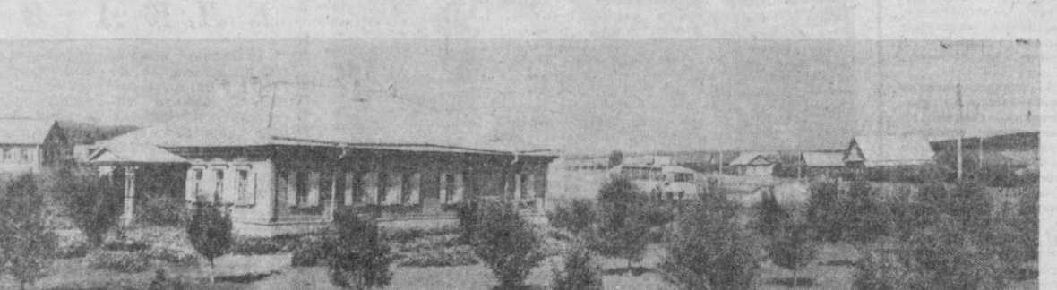
В Ленинском районе