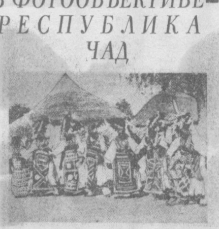
Национальный наряд одного из племени стра- ны.