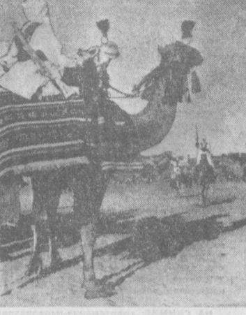
Состязание на верблюдах.

МИР СОБЫТИЯ НА ОРБИТЕ Рост дороговизны РИО-ДЕ-ЖАНЕЙРО. На 14,1 процента возросла дороговизна в Бразилии с января по июнь текущего года. Сообщая об этом, институт Варгаса указывает, что особенно подорожали квартплата, продукты питания и проезд на городском транспорте.