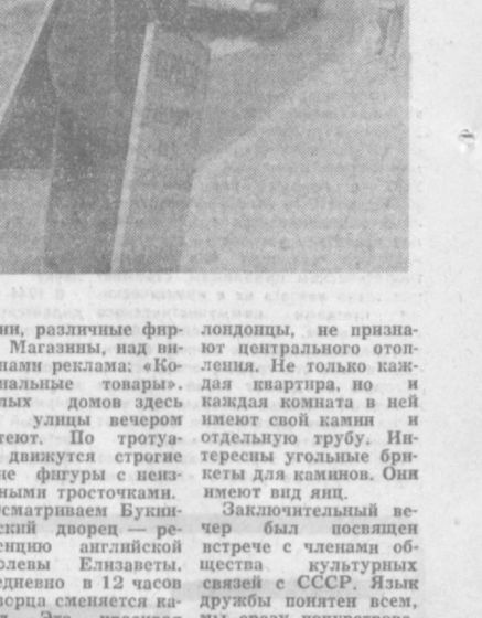
Редактор С. М. КАРАМАТОВ.