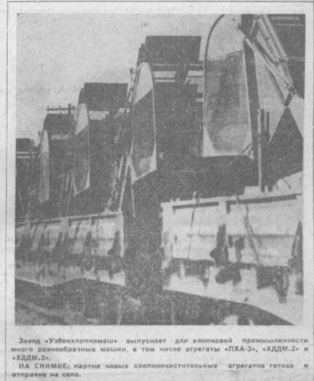
Завод «Узбеххлопмаш» выпускает для хлопковой промышленности много разнообразных машин, в том числе агрегаты «ПХА-3», «ХДМ-2» и «ХДМ-3». НА СНИМКЕ: партия новых хлопкоочистительных агрегатов готова к отправке на село.