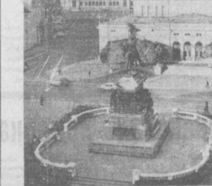
СОФИЯ. В ЦЕНТРЕ — ЗДАНИЕ ПРЕЗИДУМА НАРОДНОГО СОВРАНИЯ НРБ.

Другая важная тема в планах Общества связана с предстоящим в марте полувековым юбилеем Венгерской Советской Республики. Эта годовщина будет отмечаться не только в Венгрии, но и в братской Советской стране. Украинские отделы Общества советско-венгерской дружбы направят в Венгрию 21 марта Поезд дружбы. Приняв участие в торжествах в Будапеште, представители Львова, Одессы, Симферополя, Херсона посетят своих побратимов.