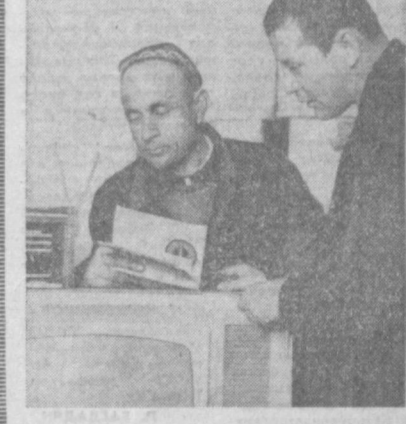
НА СНИМКАХ: подготовка экспонатов и ярмарки.