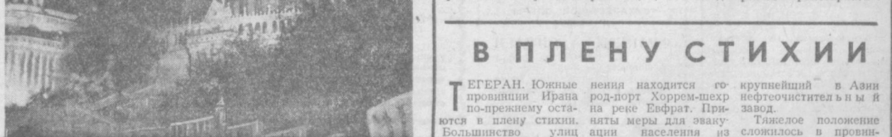
БУДАПЕШТ. БЕЛОКАМЕННЫЙ РЫБАЦИЯ БАСТИОН.