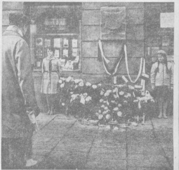
ВАРШАВЯНЕ НЕ ЗАБЫВАЮТ ПАВШИХ ПОД СТЕНАМИ ДОМОВ ОТ ГИТЛЕРОВСКИХ ПУЛЬ.

Повышение платы за аренду в домах, принадлежащих коммунальным акционер-