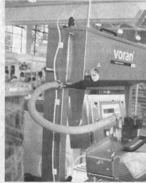
Таҳлил ва таққос

Тадбиркорликка эндигина кириб келаётганлар учун ҳам эътибор юқори. Хусусан, интернет тизимида яратилган махсус сайтлар, электрон кутубхоналар, хитойлик ва жаҳонда таниқли бўлган мутахассислар иштирокида вебинар (интернет семинар) ва видеоконференциялар ташкил этиш кичик