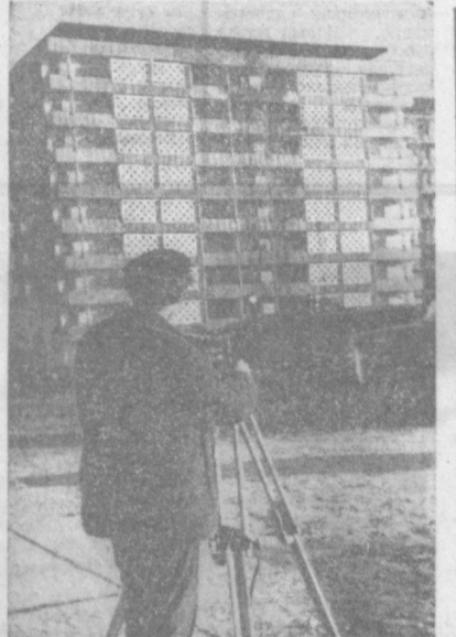
Новый дом луганчан в микрорайоне Ц-7.

МНОГО перемен произошло в Октябрьском районе столицы за два года, прошедшие со времени прошлых выборов в местные Советы. Здесь за это время появились новые многоквартирные дома, улицы, целые кварталы. Тысячи семей получили благоустроенные квартиры. О масштабах происшедших перемен говорит такая цифра — 40 новых агитпунктов при избирательных участках открывается в эти дни в районе. Даже у