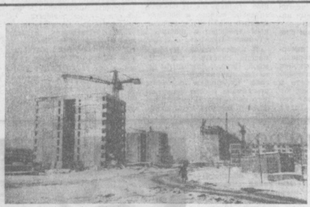
ТАШКЕНТСКИЕ НОВОСТРОЙКИ. Микрорайон Ц-5. Здесь новосибирские строители возводят два девятиэтажных 36-квартирных дома.

В Государственном специальном художественном конструкторском технологическом бюро министерства местной промышленности УССР приступили к разработке проекта сборочного конвейера для Самаркандского электромеханического завода. На нем будут производиться вентиляторы типа «Ветерок». Мощность новой линии — 8-10 тысяч изделий в год.