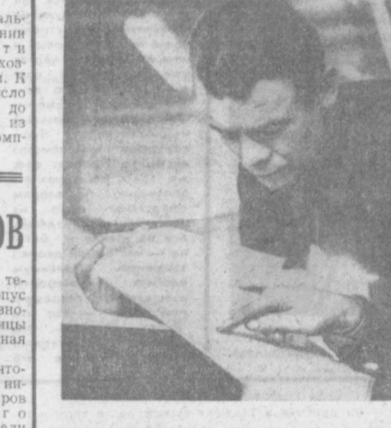
Важная роль в дальнейшем повышении производительности труда отводится хозяйственным бригадам. К концу года их число намечено довести до пятнадцати, многие из которых будут комплексовыми.

боту выполняют две пары настильщиц на трех станках одновременно. Новый метод работы позволил значительно улучшить качество изделий и на 20 процентов повысить производительность труда на этих участках.