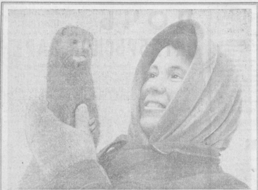
НОВОСИБИРСК. В Институте цитологии и генетики Сибирского отделения Академии наук СССР ведутся работы по получению норок новых окрасок и увеличению плодовитости этого ценного пушного зверя.