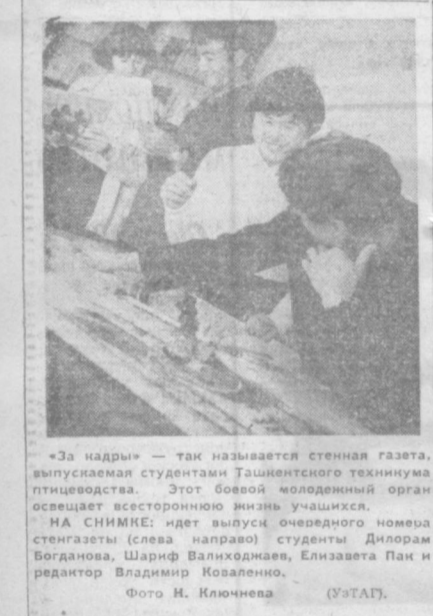
«За нядры» — так называется стенная газета, выпускаемая студентами Ташкентского техникума птицеводства. Этот боевой молодежный орган описывает все стороны жизни учащихся.

Коллектив трудится и над тем, чтобы изменить мощные дорожные котельные с привязанным газоподогревающим отоплением. Все эти мероприятия должны снизить стоимость строительства сооружений до 40 процентов, уменьшить расход металла и стекла. А если оранжерея станет больше, значительно улучшится снабжение горожан овощами в зимнее время.