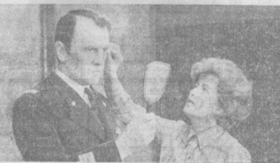
На киностудии «Мосфильм» советский режиссер Михаил Калозов продолжает съемки фильма «Красная палатка». Это совместная работа советских и итальянских кинематографистов. Для участия в съемках в Москву прибыл известный итальянский инноватор Массимо Джиротти. Советские зрители помнят его по фильмам «Рим в 11 часов», «Утраченные годы» и др. В новой картине «Красная палатка» он исполняет роль Романа — капитана итальянского судна.

«сочеталась» с огромными ворохами всевозможной бумаги, что мы, грешным делом, подумали: может, руководитель цеха решил организовать здесь приемный пункт макулатуры и тары? Оказывается, все это просто забыли вовремя убрать. «Пейзажем» беспорядочности и хлама встречает 80-й корпус. Перевентиль здесь держит двор корпус. Мусоровозы из 11, 12, 17, 23, 26, 27, 30 цехов сбрасывают отходы металла прямо на проезжую часть дороги. В 17 цехе была обнаружена нерегулярная уборка горючей пыли в слесарной мастерской с ферм и труб Батарей центрального отопления. Сильно засорены сеточные покрытия мастерской. На рабочих участках великое множество окурков». Дело дошло до того, сообщает газета, что пришлось даже «опечатать» старую мастерскую 23 цеха, так как в ней имеется целый ряд нарушений в технике пожарной безопасности. В этом помещении нет покрытия для хранения досок. Достаточно небольшой искры, чтобы вспыхнуть пожару. Несмотря на неоднократные замечания работников пожарной охраны, руководство 23 цеха хранит молчание». Аванционный завод славится своей высокой культурой производства. И не хочется верить, что руководители цехов и предприятия смирились с подобными фактами. Рейд рабкоров «Узбекистана» — серьезный сигнал организаторам производства. Мероприятия, разрабатываемые на заводе в связи со сменой, должны быть взяты под контроль и реализованы.