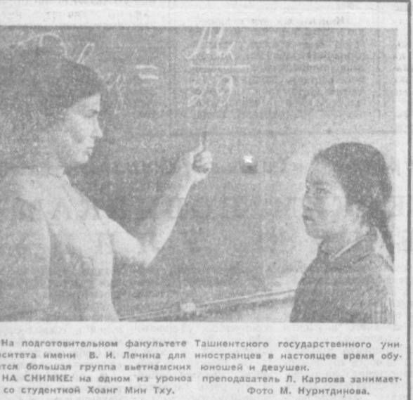
На подготовительном факультете Ташкентского государственного университета имени В. И. Ленина для иностранцев в настоящее время обучается большая группа вьетнамских юношей и девушек.

Большая часть «корпусов», действующих в Сомали, принадлежат газете, сформированной из американских сионистов, ведущих пропаганду в пользу Израиля в сомалийских учебных заведениях и общественных местах. «Наш долг, — подчеркивает «Альтире Талих», — состоит в том, чтобы обезвредить идеологический яд, распространяемый в Сомали «Корпусом мира». В. БУЛИМОВ.