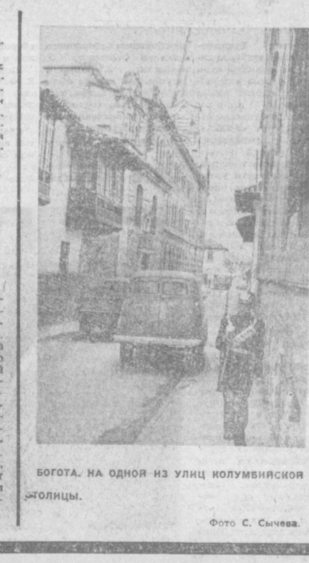
БОГОТА. НА ОДНОЙ ИЗ УЛИЦ КОЛУМБИЙСКОЙ ГОЛЛИЦЫ.

ДАРС-САЛАМ. По сообщениям из Юганне с бургомистром обороны ЮАР Питер Бота объявил о новых шагах с целью увеличения боевой мощи военно-воздушных сил расистского режима. Правительство Южной Африки намерено приобрести за границей новые самолеты.