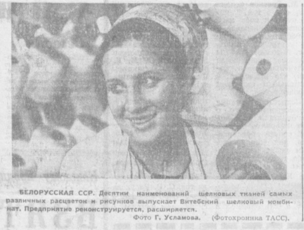
БЕЛОРУССКАЯ ССР. Десятки наименований шелковых тканей самых различных расцветок и рисунков выпускает Витебский шелковый комбинат. Предприятие реконструируется, расширяется.

производства. Что это даст производству? Сохранение времени, экономия топлива, материала, увеличение выпуска цемента. Работы над новым способом продолжают. Известно, что изготовление силикатного кирпича (смесь песка и извести) обходится дешевле, чем жженого. Однако здесь есть своеобразное «но». При кладке стен он сцепляется с раствором гораздо хуже, чем обычный кирпич. Естественно, получение цемента при температуре этого кирпича. Для заводов Ашхабада, Коканда, где выпускается этот кирпич, со-