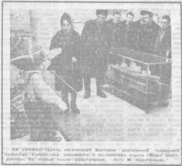
НА СНИМКЕ: группа посетителей Выставке достижений народного хозяйства Узбекистана знакомятся с экспонатами отдела «Юный конструктор». На первом плане — робот-ученик.