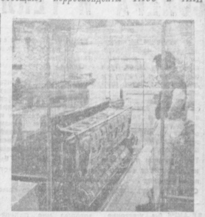
ИСЛАНДИЯ. В Москве в январе этого года состоялось подписание контракта между «Разноэкспорт» и представителями исландских кооперативов о поставке в Советский Союз в 1969 году шерстяных изделий на общую сумму около 90 миллионов ирон. Это один из крупнейших контрактов на поставку промышленных изделий, заключенных Исландией. НА СНИМКЕ: изготовление пледов по советскому заказу на фабрике «Гейсон» в городе Акурейри.

Н А СТРАНИЦАХ японских газет в разделе «Яркие события» часто появляются заметки о многочисленных убийствах, дорожных происшествиях, хищениях, изнасилованиях. В таких сообщениях описываются детали преступления и трагические случаи. Авторы ограничиваются описанием только фактической стороны дела — мораль здесь никого не интересует. Создается впечатление, что заметки этого рода пишут не люди, а электронные машины: все они, как две капли воды, похожи друг на друга. Удивляться числу преступлений особенно не приходится. Все, что молodeжь видит в кино, на экранах телевизора, все, что предлагает массовая литература, дружат юности и девушкам к тому, что убить человека — это довольно просто. Взять и убить — это дело, которое делают люди, которые выйдут из моды, красавица и модный торшер дождет актуальности своего предмета «ничуть не хуже». И при случае доказывают это. Естественно, например, телевизионная передача была посвящена тому, как в Мемфисе молодые