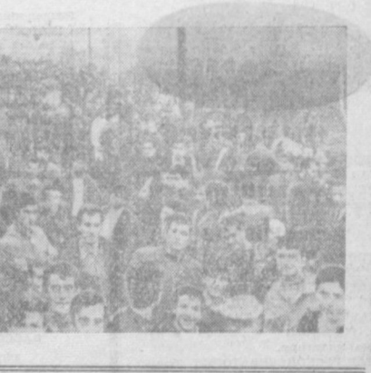
● НРАВЫ «СВОБОДНОГО» МИРА

люди, носящие одежду «назад к природе», направляют друг с другом. Нарин на мотоциклах на большой скорости мчатся друг на друга. Один из них погибает. Операторы долго смаковали, как оставшаяся в живых несколько раз проехал на мотоцикле по повороченному. Если у погибшего есть близкий друг, который дождет актуальности своего предмета «ничуть не хуже». И при случае доказывают это. По окончании передачи был проведен опрос среди молодых японцев. Все ответили, что это любопытно и даже увлекательно. Некоторым добавили, что Нельсоном было бы и самим испытать. Я все видел слова «бесчеловечно». Не дождался... В убийствах, воровстве, насилии в большинстве случаев замешаны молодые. Молодые люди убивают и гибнут. И каждый случай смерти, судя по тому, как ведется расследование, вызывает особое сострадание. Газетами издается сенсация — больше читателей, больше нем. В мире чистоты смерти — тот же бизнес. В. ДУНАЕВ.