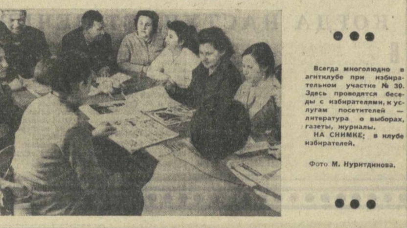
Всегда многолюдно в агитклубе при избирательном участке № 30. Здесь проводятся беседы с избирателями, к услугам посетителей — литература о выборах, газеты, журналы.