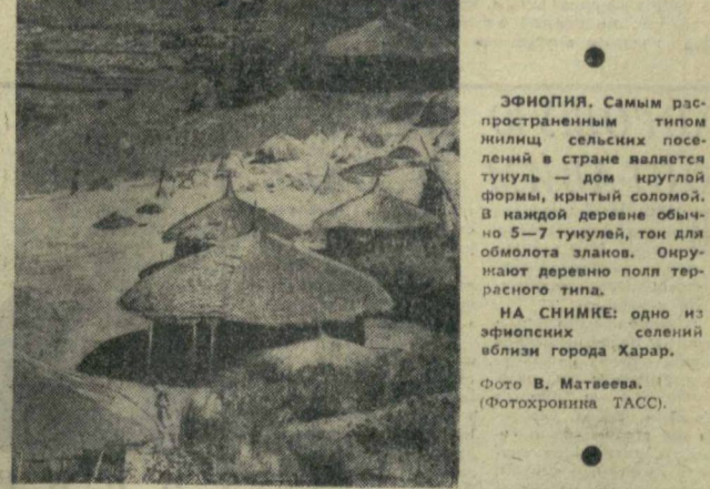
ЭФНОПИЯ. Самым распространенным типом жилищ сельских поселений в стране является туниель — дом круглой формы, крытый соломой. В каждой деревне обычно 5-7 туниелей, тон для обмотки златов. Окружают деревню поля террасного типа. НА СНИМКЕ: одно из эфнопийских селений вблизи города Харар.

Каждому из нас стало известно, что в Туркмении и Таджикистане, Марийской ГРЭС в Туркмении и другие объекты — общей мощностью 25 миллионов ватт. Возникнет единая энергетическая система Средней Азии. При этом основное распределение мощностей электростанций будет происходить на напряжении 500 киловольт. Предусмотрены опережающие темпы развития энергетики по сравнению с ростом других отраслей народного хозяйства.