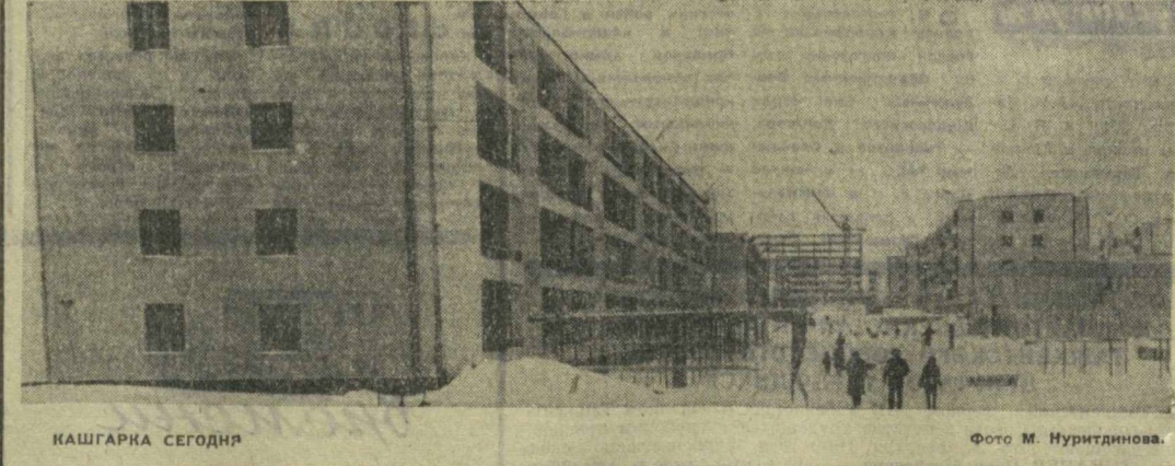
КАШГАРКА СЕГОДНЯ

ПОСЛЕ окончания строительного училища в г. Саратове по комсомольской путевке я строил Степановский газо-нефтяной промысел, поселок нефтяников. Это в шестидесяти километрах от Саратова, на левом берегу Волги. И вот уже больше года мы с женой строим новый Ташкент. Сейчас уже привыкли, но все равно поражаемся размерам эдшего строительства. По сути дела, построен другой — огромный город. Скоро мы уедем домой. Но где бы я ни был, всегда буду вспоминать о гостеприимстве Ташкента, о нашей дружбе с его жителями. За это я и буду голосовать 16 марта 1969 года. Н. ВОДЯНЕНКО, инженерный Саратовского СМП, член КПСС.