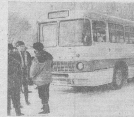
Сегодня в Ташкенте без осадков. Температура ночью — 15-17 градусов мороза.

На время отложили мастера строители из строительств № 5. Больше ста человек их пришло на помощь фрунзенцам.