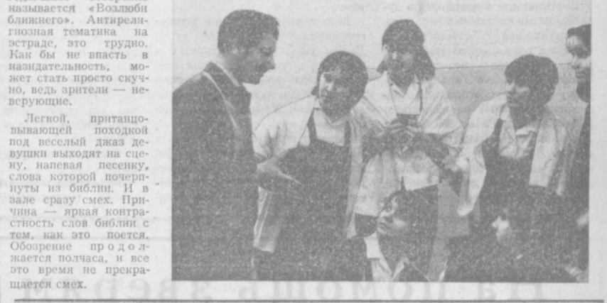
НА СНИМКЕ: «Ниточка» на репетиции.