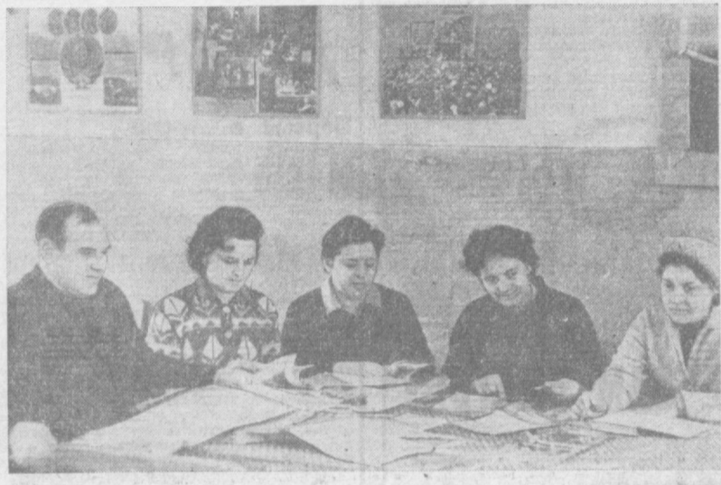
Всегда многолюдно в агитпункте при избирательном участке № 15 Хамзинского района. НА СНИМКЕ: группа избирателей в агитпункте знакомятся с литературой о выборах в местные Советы.