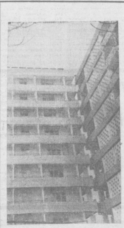
Замечательные дома-дворцы построили в столице нашей республики посланцы Харькова. На этом снимке один из девятиэтажных домов харьковчан, возведенный в украинском микрорайоне Ц-7.