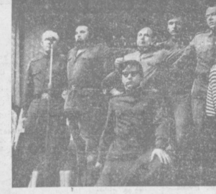
Фото Е. Зуева.

В. МАТВОВ. Очень талантливые ребята, — сказал о них один из членов жюри, заслуженный артист республики С. Вахидов. Первый республиканский смотр показал, как много талантов и способностей в нашей партии. Теперь можно уверенно сказать — второй смотр будет еще успешнее. На снимках: (вверху) — певцы из Бухары, (внизу) — сцена из постановки «Реквием». Фото Е. Зуева.