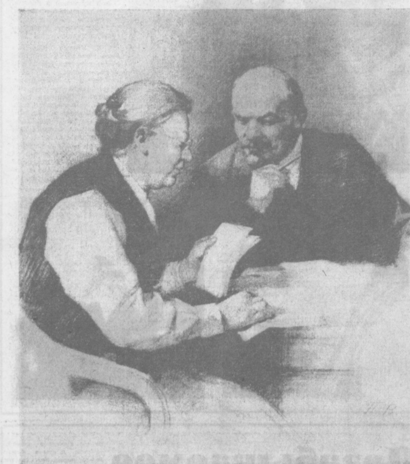
В. И. ЛЕНИН И Н. К. КРУПСКАЯ. Рисунок П. Васильева.

СЕГОДНЯ ИСПОЛНИЛОСЬ 100 ЛЕТ СО ДНЯ РОЖДЕНИЯ НАДЕЖДЫ КОНСТАНТИНОВНЫ КРУПСКОЙ... ВЫДАЮЩЕГОСЯ ПАРТИЙНОГО И ГОСУДАРСТВЕННОГО ДЕЯТЕЛЯ, ДРУГА И СОРАТНИКА В. И. ЛЕНИНА