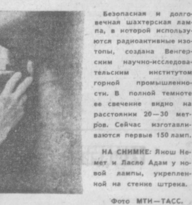
Безопасная и долговечная шахтерская лампа, в которой используются радиоактивные изотопы, создана Венгерским научно-исследовательским институтом горной промышленности.

НЬЮ-ЙОРК. 24 февраля вечером с мыса Канада в сторону планеты Марс с помощью ракетной системы «Атлас-Нентав» был произведен запуск космической станции «Маринер-6».