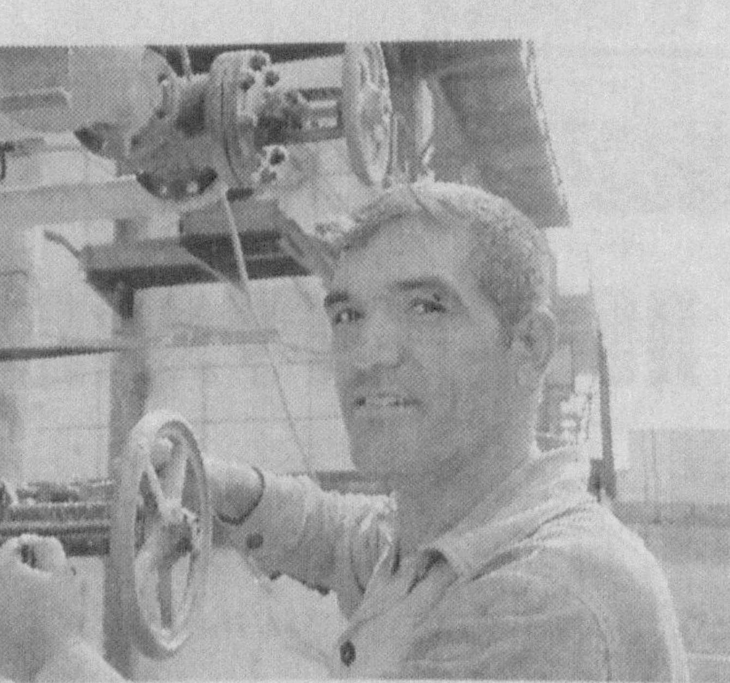
лар ишини мувофиқлаштириш бўлими билан ҳамкорликда лифтдан фойдаланувчи мулк эгалари ҳисобидан 11 та лифт таъмирланди, — дея сўзини давом эттирди уюшма раиси.

— Самарқанд шаҳар ҳокимлиги, шаҳар коммунал хўжалик департаменти ширкат-