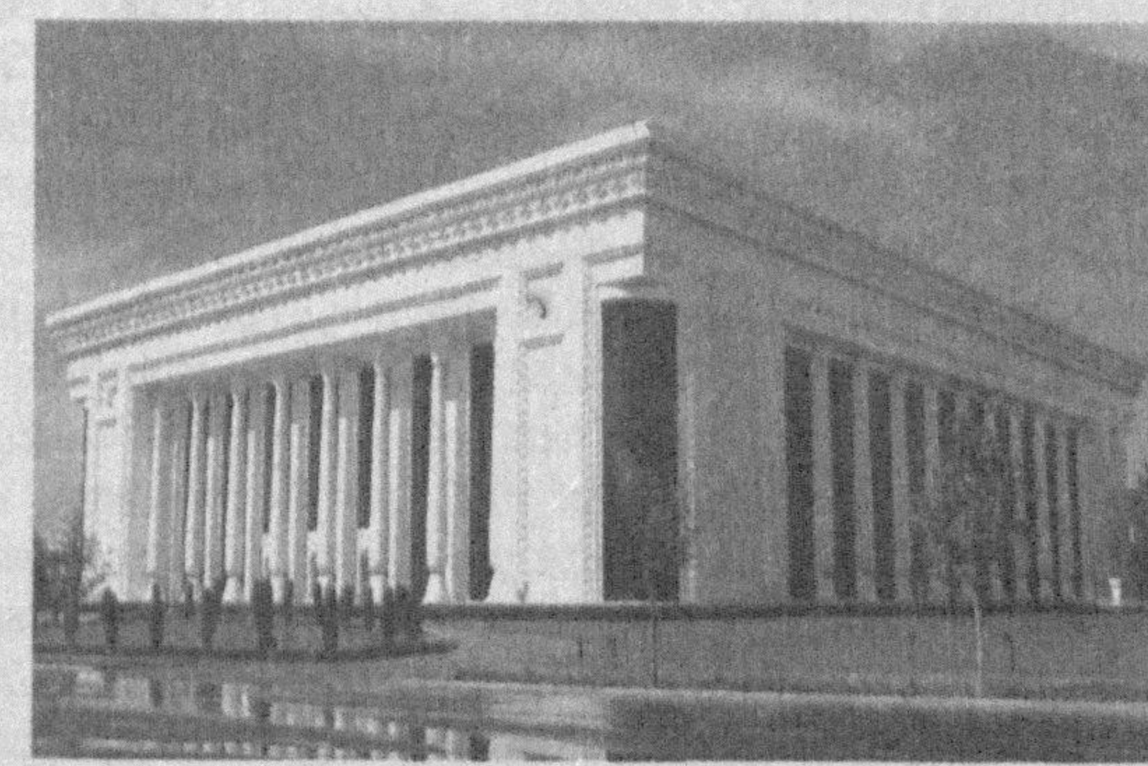
«Ўзбекистон» халқро анжуманлар саройида 5 декабрь кунни Ўзбекистон Республикаси Конституцияси қабул қилинганининг 17 йиллигига бағишланган тантанали йиғилиш бўлиб ўтди. Унда давлат ва жамоат арбоблари, фан, маданият ва санъат намоёндалари, пойтахт жамоатчилиги, мамлакатимизда фаолият юритаётган хорижий давлатларнинг элчихоналари ва халқро ташкилотлар ваколатхоналари вакиллари иштирок этди.