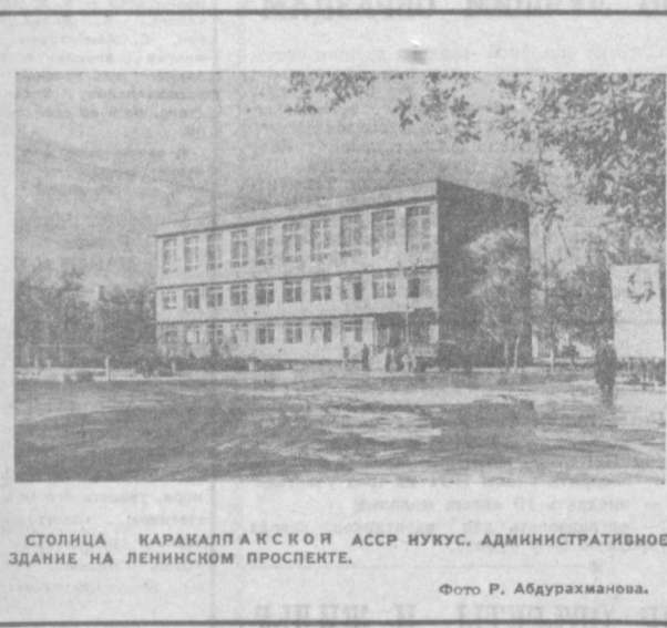
СТОЛИЦА КАРАКАЛПАКСКОЙ АССР НУКУС. АДМИНИСТРАТИВНОЕ ЗДАНИЕ НА ЛЕНИНСКОМ ПРОСПЕКТЕ.