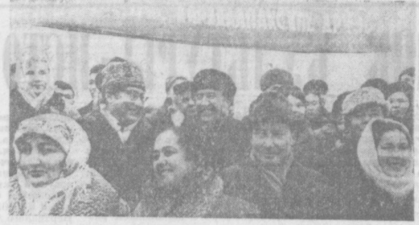
Встреча участников Недели литературы и искусства Каракалпакской АССР на ташкентском вокзале. Министр культуры Узбекской ССР В. Захидов приветствует посланцев братского народа.