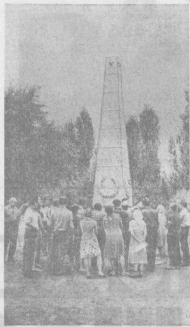
В прошлом году по приглашению Министерства культуры АССР в Нукус выехал Государственный академический театр русской драмы имени Горького. За время пребывания творческий коллектив показал каракалпакским зрителям более 6 спектаклей, которые прошли с большим успехом. Горьковцы также побывали в гостях у строителей Тахнаташской ГРЭС, посетили древний город Ходже-ли. И куда бы ни приезжали посланцы солнечного Узбекистана — везде их ждал теплый и радующий прием. НА СНИМКЕ: работники театра имени Горького возлагают венки у монумента героев, павших за установление Советской власти в Каракалпакии.

К. ХУДАЙБЕРГЕНОВ, министр культуры КК АССР.