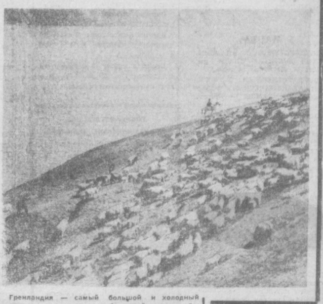
Гренландия — самый большой и холодный остров на земле, покрытый зимой и летом более чем на три четверти толстым слоем льда. Одним из основных занятий населения является овецводство. НА СНИМКЕ: овцы на пастбище в одном из немногих районов острова, где плодородные долины не покрыты льдом.

Н БЮ-ИОРК. Правящие круги США пытаются решить проблему инфляции путем увеличения безработицы, т. е. за счет трудящихся. Глава одного из крупнейших банков США «Чейз манхэттен банк» Дэвид Рокфеллер откры- венно заявил в интервью корреспонденту газеты «Чикаго дейли ньюс», что «рост безработицы — это та цена, которую Соединенные Штаты должны заплатить», чтобы предотвратить дальнейший рост инфляции.