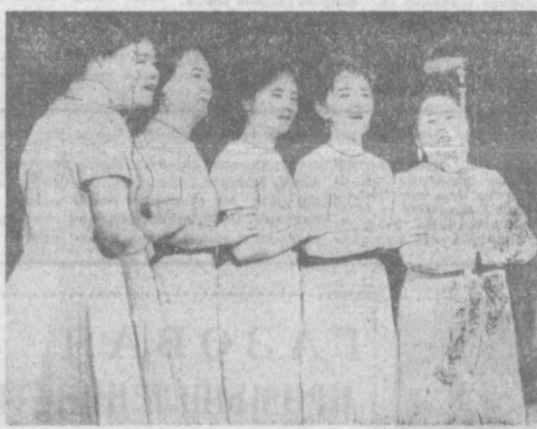
НА СНИМКЕ ВЫСТУПАЕТ ЖЕНСКИЙ ВОКАЛЬНЫЙ АНСАМБЛЬ ГОСФИЛАРМОНИИ ИМЕНИ БЕРДАХА.