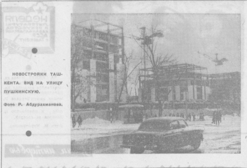
НОВОСТРОЙКИ ТАШКЕНТА. ВИД НА УЛИЦУ ПУШКИНСКУЮ.

Многие в своей работе упускают и благоустроители. Не всегда экономно мы расходую материалы и денежные средства. Некачественно производится строительные работы. Примером этого может служить