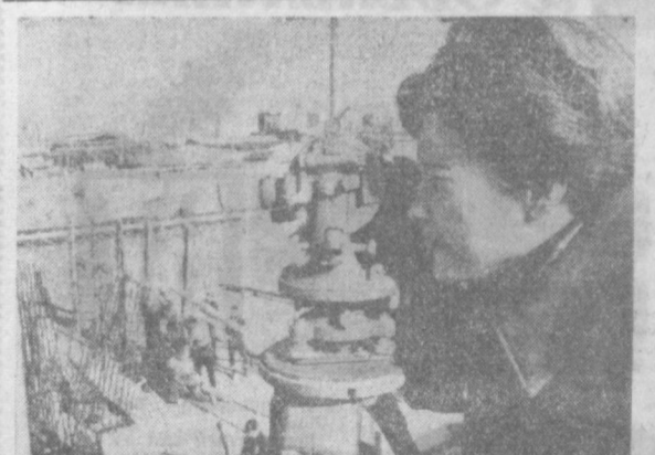
ВЕНГЕРСКАЯ НАРОДНАЯ РЕСПУБЛИКА. Современная женщина в социалистических странах не в чем не уступает мужчине, выполняя равные с ним ответственные задания во всех областях народного хозяйства. Перед вами — один из инженеров, проектирующий строительство новой глиноземной фабрики в городе Аяка.

явного урегулирования во Вьетнаме. В предложенной им резолюции содержится требование к английскому правительству прекратить поддержку американской агрессии во Вьетнаме. В другой резолюции участники конференции потребовали вывода израильских войск с оккупированных арабских территорий.