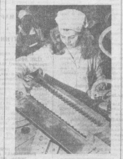
В Советском Союзе хорошо известна болгарская зубная паста «Поморник». Ее производит парфюмерная фабрика «Ален Ман» в Пловдиве. В связи с празднованием 25-летия Болгарии в этом году будет значительно расширен ассортимент товаров, выпускаемых этим предприятием: мыла, питательных кремов, губной помады, духов, зубной пасты. НА СНИМКЕ: в цехе, где выпускается «Поморник».

СОФИЯ. Болгарский народ отмечает 91-ю годовщину освобождения своей страны от пятивекового османского ига. В честь знаменательной даты в городах и селах страны проходят торжественные собрания и заседания, к памятникам русским воинам-освободителям возлагаются венки. Болгарская печать посвящает годовщине статьи, публикуются документы прошлого и другие материалы. Кровь сынов России, пролитая за освобождение нашего отечества, пишет «Рабочничко дело», навсегда связала болгар и русских узлами братства и немеркнувшей любви.