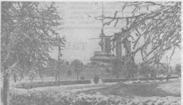
ЛЕНИНГРАД, НА БЕРЕЖНОЙ НЕВЫ У КРЕйсЕРА «АВРОРА».