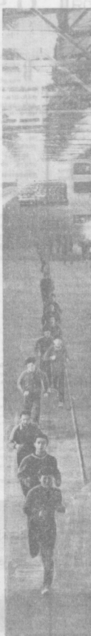
НА СНИМКЕ: НА СПОРТИВНОЙ АРЕНЕ «ЕШЛИК» ИДУТ ЗАНЯТИЯ ГРУППЫ ЛЕГКОАТЛЕТОВ ЧЕТВЕРТОГО КУРСА ПЕДАГОГИЧЕСКОГО ФАКУЛЬТЕТА УЗБЕКСКОГО ГОСУДАРСТВЕННОГО ИНСТИТУТА ФИЗИКУЛТУРЫ.