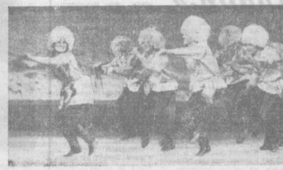
НА СНИМКЕ: АНСАМБЛЬ КАРАКАЛПАКСКОГО ГОСИЛАРМОННИ ИСПОЛНЯЕТ «ТАНЕЦ ДЖИГИТОВ».

Каждый наш приезд в узбекскую столицу — это большой праздник. Здесь мы знакомимся с новыми интересными людьми, участвуем в литературных вечерах, дискуссиях, делимся впечатлениями, творческими планами. В Каракалпакии вышли два моих сборника стихов как родном языке. Мои произведения были переведены на русский, узбекский языки. Они печатались в журнале «Звезда Востока», «Шар-Юлдуз», республиканских газетах. Каждый наш приезд в узбекскую столицу — это большой праздник. Здесь мы знакомимся с новыми интересными людьми, участвуем в литературных вечерах, дискуссиях, делимся впечатлениями, творческими планами. В Каракалпакии вышли два моих сборника стихов как родном языке. Мои произведения были переведены на русский, узбекский языки. Они печатались в журнале «Звезда Востока», «Шар-Юлдуз», республиканских газетах.