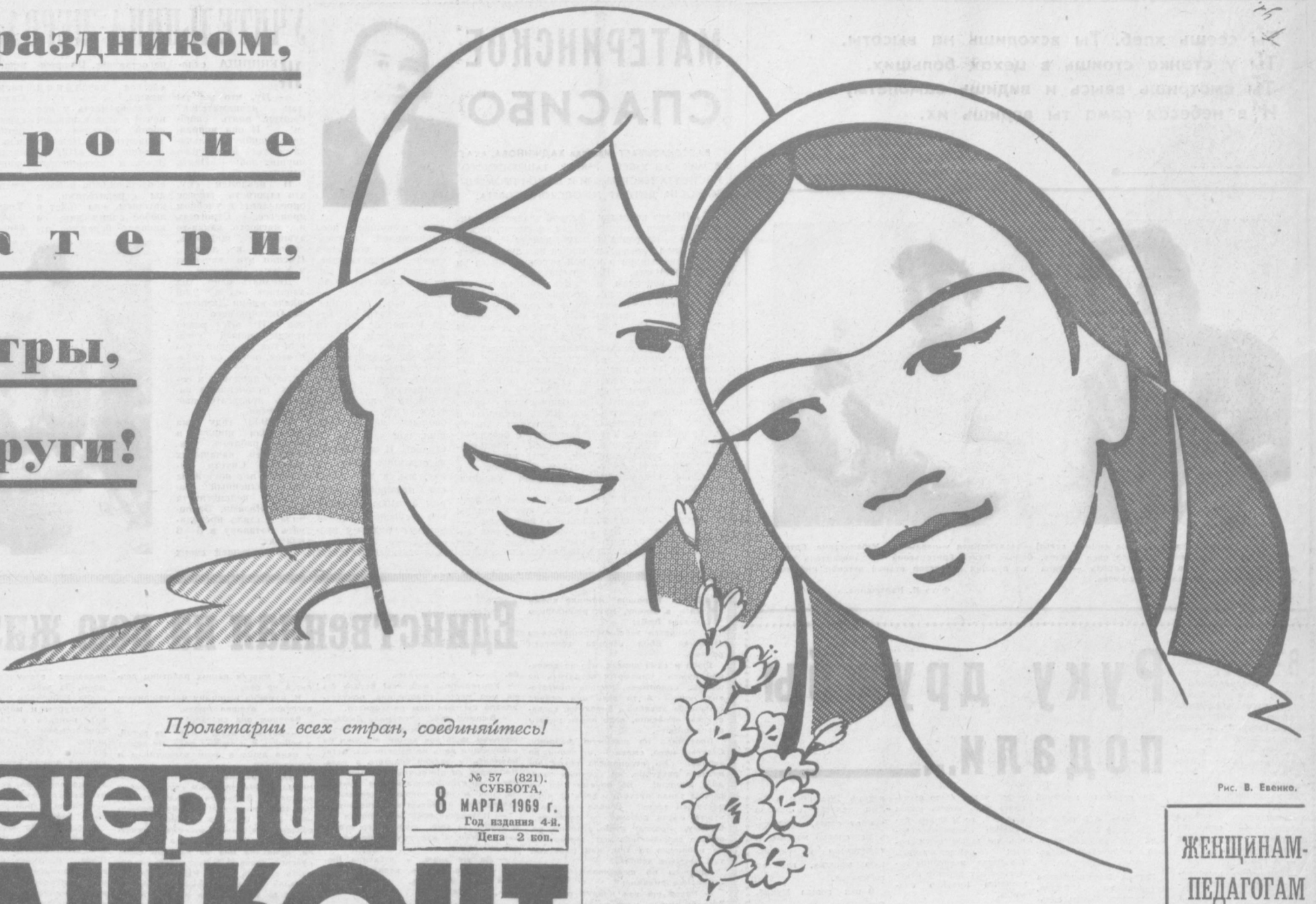
Рис. В. Евенко.