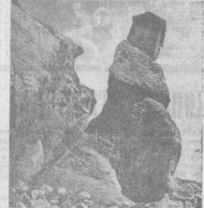
Фото Э. Габриелла. (АПН). Февраль 1969 г.

В Армении на скалистом уступе одного из многочисленных ущелий, рассекающих склоны четырехглавого Арагаца, уже много веков неземно стоит сооружение древнего монастыря Арч. Летописи свидетельствуют, что этот замечательный архитектурный комплекс (он является одним из лучших образцов древнеармянского зодчества, построен в 1224 году князьями Иване и Занаре Аргутянами. Когда-то огромной силы землетрясение откололо от каменной гряды часть утеса с монастырской часовней на вершине. Как ни удивительно, но эти монастырские сооружения совершенно не пострадали от мощных подземных толчков. И вот уже несколько веков нависшая над пропастью часовня прочно стоит на наклонившемся утесе. И только порой сильные горные ветры расщипывают ее вместе со скалой.