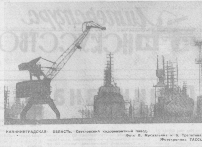
КАЛПИНГРАДСКАЯ ОБЛАСТЬ. Светловский судоремонтный завод.