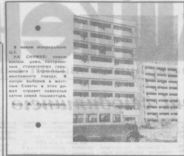
В новом микрорайоне Ц-3.

НА СНИМКЕ: новые жилые дома, построенные строителями горьковского строительного монтажного поезда. В канун выборов в местные Советы в этих домах спривают новоселье сотни семей ташкентцев.